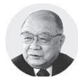
理研興業の風雪55年の研究が、北

NETISに登録された「高性能防雪柵(誘導板付反転式柵)」「自動取納型高機能防雪柵」「既設防雪柵対応型自動建込・取納型」「鋼管杭への支柱接続工法」「ZIG」など、優れた製品や技術を開発している。